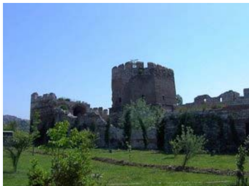
Sfârșitul Imperiului Bizantin

Datorită prestigiului său, imperiul bizantin a putut să răspândească în lumea Evului Mediu o puternică influență