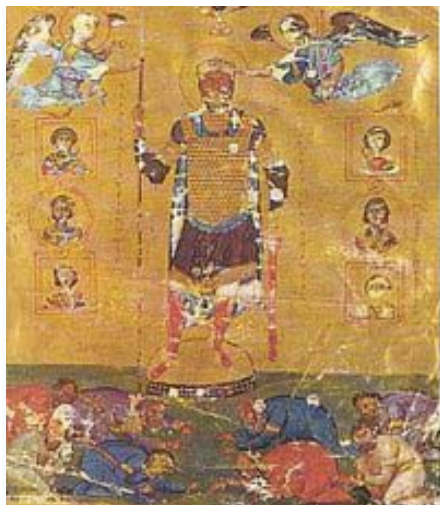
Miniatură înfățișându-l pe Vasile al II-lea (secolul al XI-lea)

Printre importantele porți ale incintei, Poarta de aur era cea prin care patrundea în oraș cortegiile militare și triumfale.