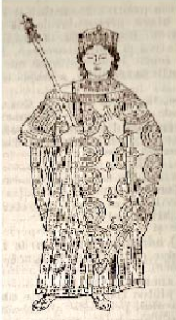
imparat bizantin din primele secole in costum de ceremonie

Desigur ca totul era doar o iluzie, dar in organizatia interna a imperiului se mentinea traditia romana, institutiile romane continuau traditia sa dureze si, desi evoluand cu incetul, in timp ele isi lasau urmele in multe institutii bizantine (3).