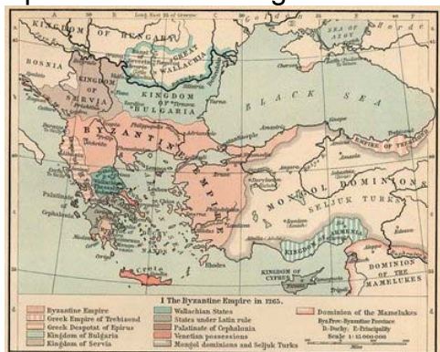
Imperiul Bizantin în 1265 (William R. Shepherd)

Arhitectura Imperiului Bizantin este ilustrata intr-o maniera frapanta de marele zid de incinta al Constantinopolului, aparat de 200 de turnuri. In plan civil arhitectura bizantina se situeaza la raspantia dintre lumea romana si cea orientala. Influenta romana este reprezentata de terme si forumuri, iar cea orientala este perceptibila in adoptarea bisericii cu cupole, asa cum este Bazilica Sfanta Sofia, construita intre 532 si 537. Epoca de aur a arhitecturii bizantine este reprezentata si de Bazilicile Sfintii Apostoli si Sfintii Sergius si Bacchus din Constantinopol.